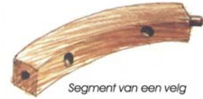
Segment van een velg

Eerst werd de buitenvorm van de naaf of 'asdoemp' gedraaid op de draaibank. Aan de buitenkant moesten dan de openingen voor de spaken geboord en gekapt worden. Het asgat moest met grote nauwkeurigheid geboord worden. Tenslotte werden er door de smid twee ijzeren banden rond gesmeed.