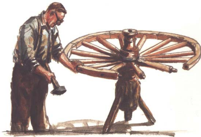
Het in elkaar zetten van een karrenwiel

De smid bepaalde vervolgens de grootte van de velg die iets te klein werd gemaakt. Door verhitting en uitzetting kon zij toch rond het wiel gezet worden. Vervolgens werd de velg met water gekoeld om ze precies te doen passen.